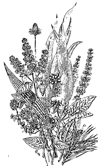
Heilpflanzen im WALA-Garten